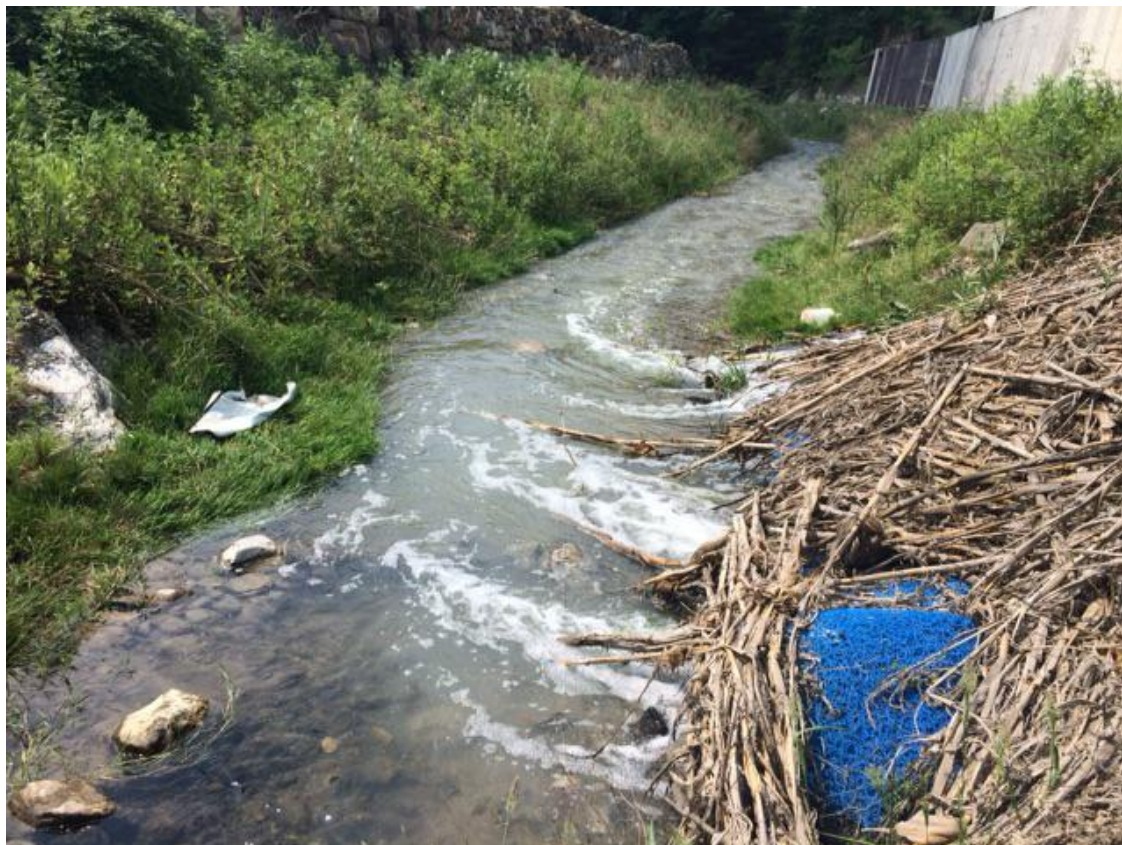
（一尾矿库大坝下方，大量浑浊的废水从枯草掩埋的洞口涌出）

2019年6月，绿网在河南省内的栾川县、汝阳市、灵宝市等地进行了部分矿区污染情况的专项调查，并取样检测，将结合检测结果对实地调查后的污染问题，向环保部门进行书面举报。