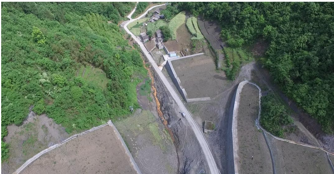
（陕西调查发现修复整治后的渣场仍有酸性黄色渗漏液流出）

2019年5月，绿网在陕西省内的汉中、安康、商洛等地进行了部分矿业企业污染情况的专项调查。