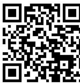
广安市生态环境局回复