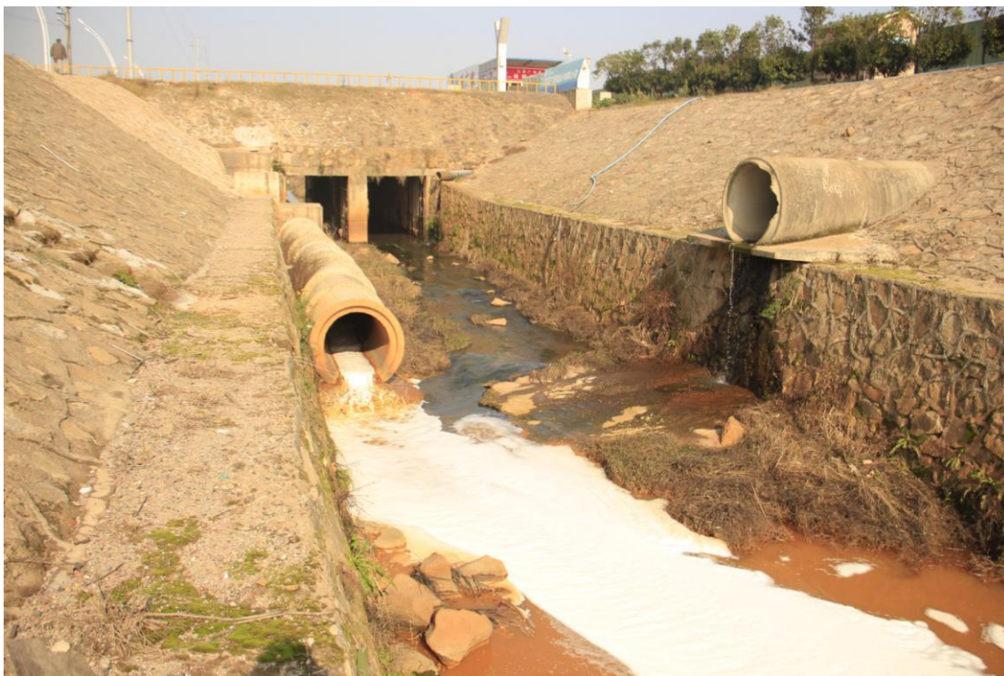
(抚北工业园废水直排)

11月，广州绿网开启了江西涉矿企业的专项调查，并对实地调查后的污染问题，向环保部门进行了书面举报。