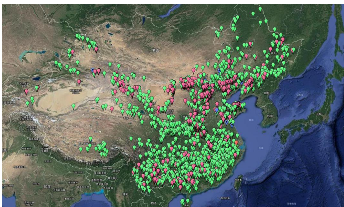
(上图: 全国尾矿库分布图)

广州绿网为环境保护部环境工程评估中心提供青海省尾矿库和土壤数据,用于区域环境状况研究。