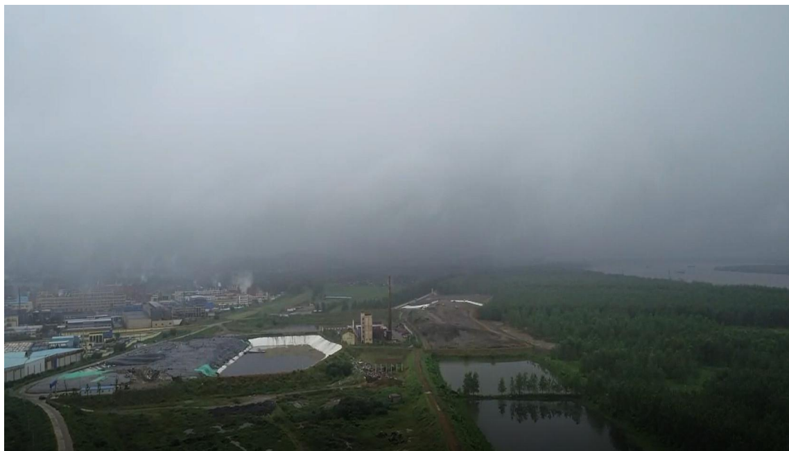
湖北石首，生活垃圾卫生填埋场距离长江直线距离不到1公里

9月，广州绿网开展了湖北以及山西煤矿行业的专项调查，并对实地调查后的污染问题，向环保部门进行了书面举报。