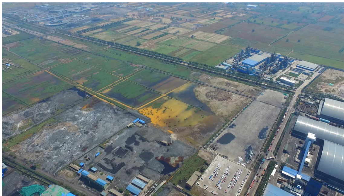
山西清徐县，厂区外流淌着黄色废水